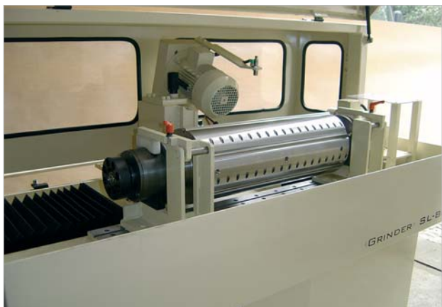
Albero piolla, 670 mm, completo di sistema di supporto e attacco rapido in posizione di affilatura.