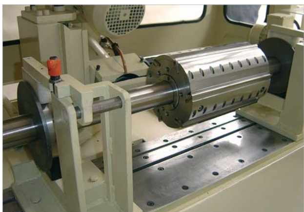
Teste idro, 350 mm, con albero di supporto in posizione di affilatura.