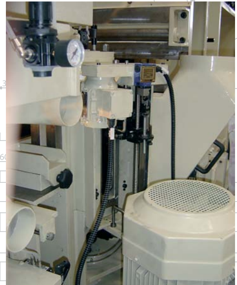
regolazione automatica dei Joints nelle unità verticali