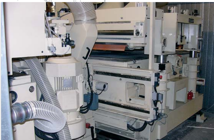
Macchina base su traslatore per lo sfruttamento dei coltelli su tutta la larghezza (le unità verticali e il gruppo di estrazione restano in posizione)