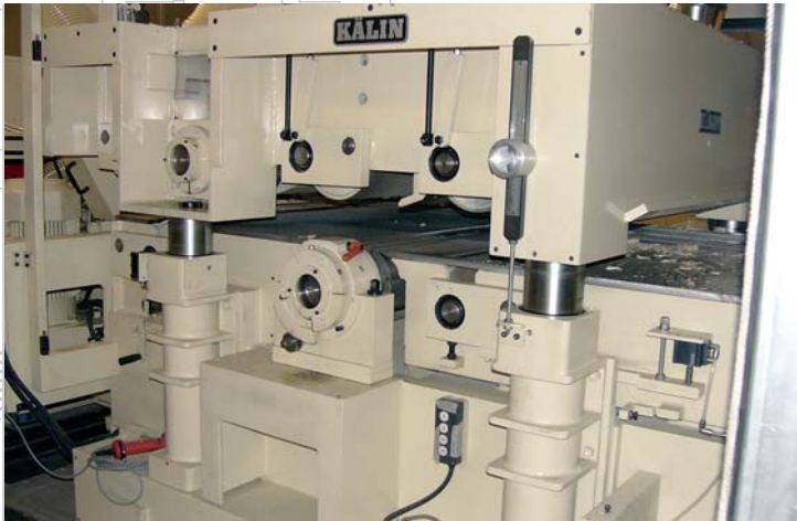
Alberi orizzontali con oscillazione idraulica